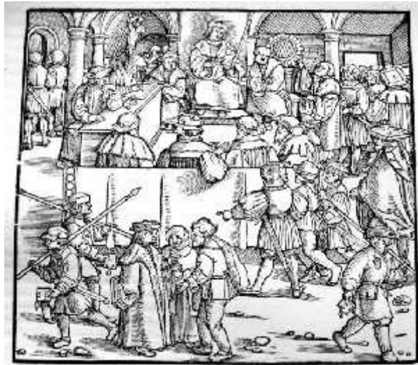
"Gerichtsverhandlung" - gedruckt zu Straßburg 1530