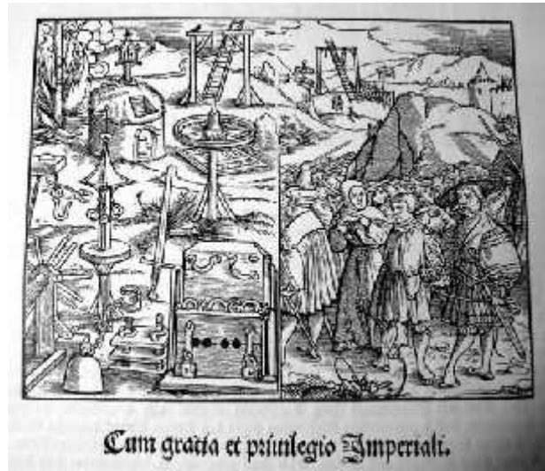
Faksimile des Titels von Kaiser Karl V. peinlicher Gerichtsordnung

50. Ob der Untersuchte bei den vorher erwähnten Hexentänzen nie getaufte Kinder in Teufels Namen