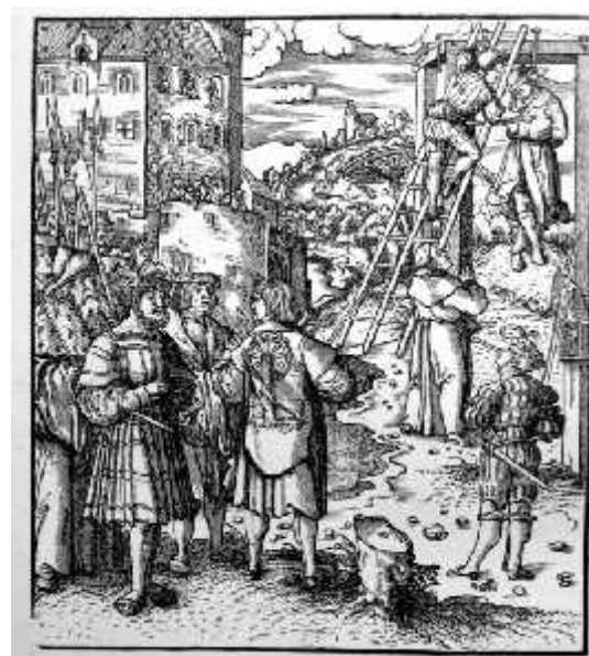
Richtstätte mit Galgen und Rad um 1500 (Hans Burgkmair und Kunstgenossen)