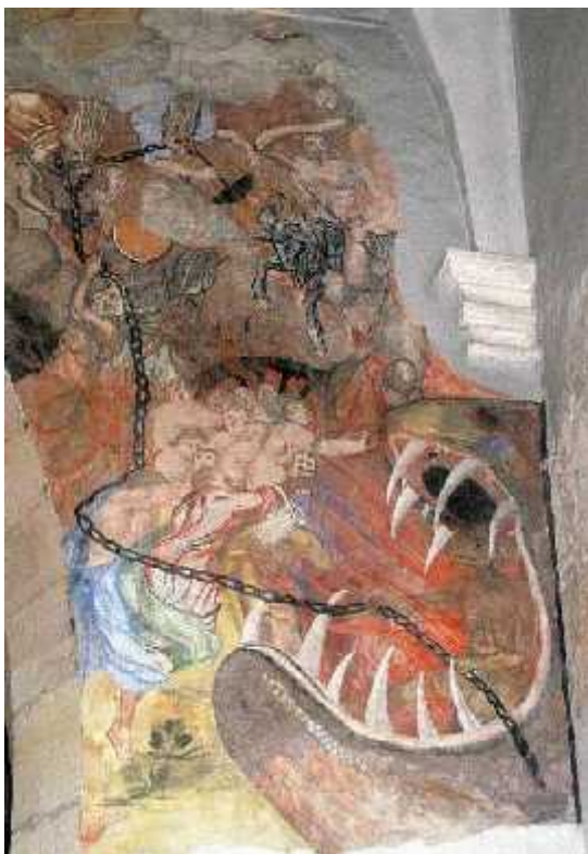
Freska v župnijski cerkvi Ormož

izvedenskem mnenju, navsezadnje na podlagi milostljivega ukaza častivredne notranjeavstrijske vlade z obsodbo za mučenje, ampak ponovno brez mučenja.