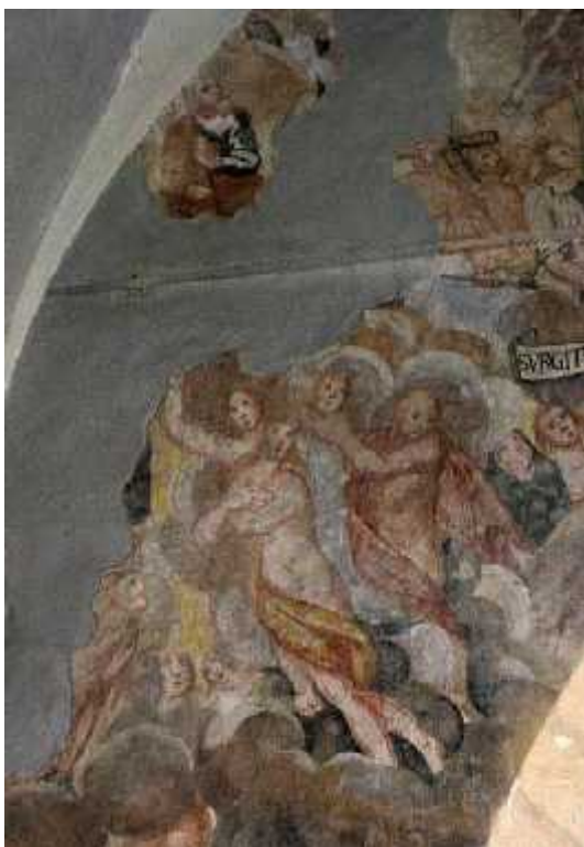
Freska v župnijski cerkvi Ormož

Odgovor: Nenehno spreminja besede in ne da nobenega pravega odgovora.