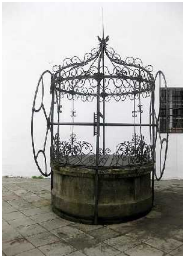
Vodnjak na notranjem dvorišču gradu Ormož