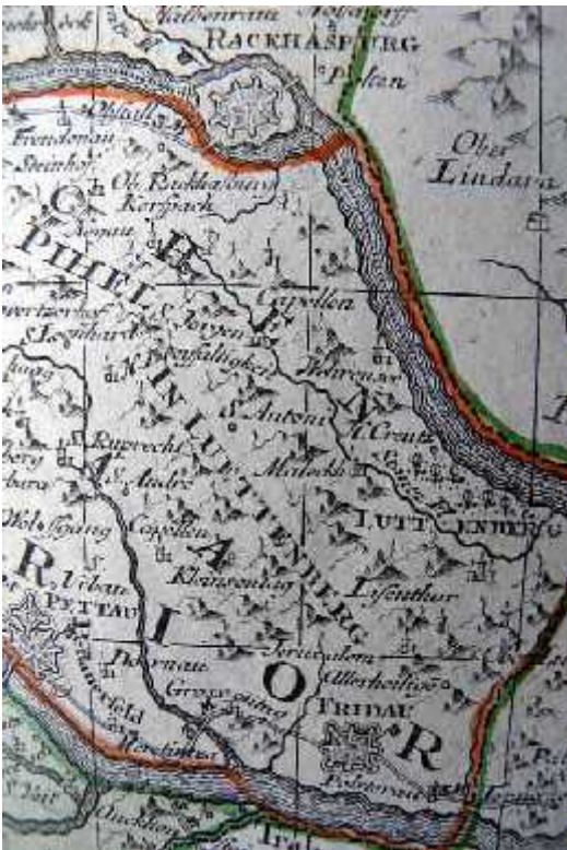
Ormož, Ptuj in Radgona

15. Marca 1677 je Dorothea Wed, meščanka Središča ob Dravi, stara 70 let, zaradi prijave častivredni notranjeavstrijski vladi in ene z moje strani (spodaj podpisanega) izpeljane preiskave in zaradi večih znakov, po izvršenem prijetju brez mučenja, bila zaslišana pod okriljem deželnega sodišča.