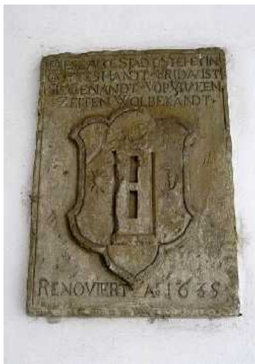
Napis na območju vhoda v grad Ormož za prenovo leta 1635

Vprašanje: Kako lahko reče, da je zdrav, ko pa je njegova desna roka popolnoma neuporabna.