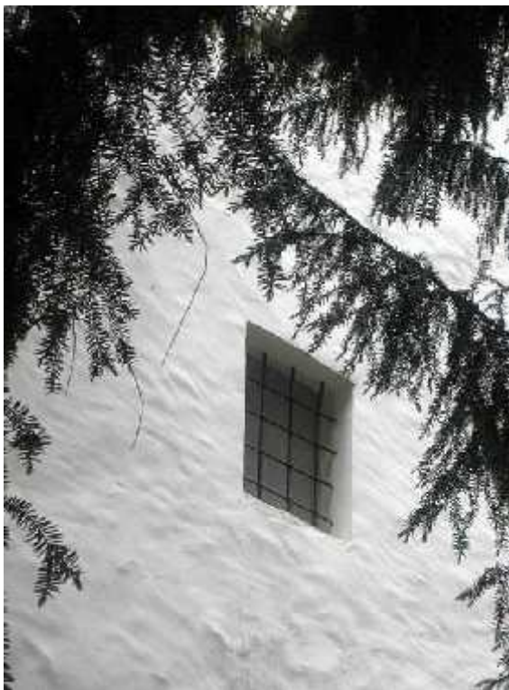
Okno na gradu Ormož

Vprašanje: Zakaj se poslužuje neresnice in si upa reči, da ni nič slišala o bolezni te Barbare, ko pa je Barbara poslala Anno Schuster k njej (k Wedovi) in jo prosila, da ji pomaga, če je ona povzročila njeno bolezen.