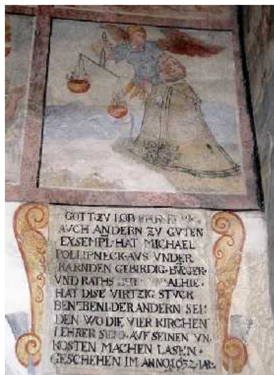
Freska v župnijski cerkvi Ormož

Izvirno besedilo se nahaja v Štajerskem deželnem arhivu pod kodo COP 1677-V-4 (K738).